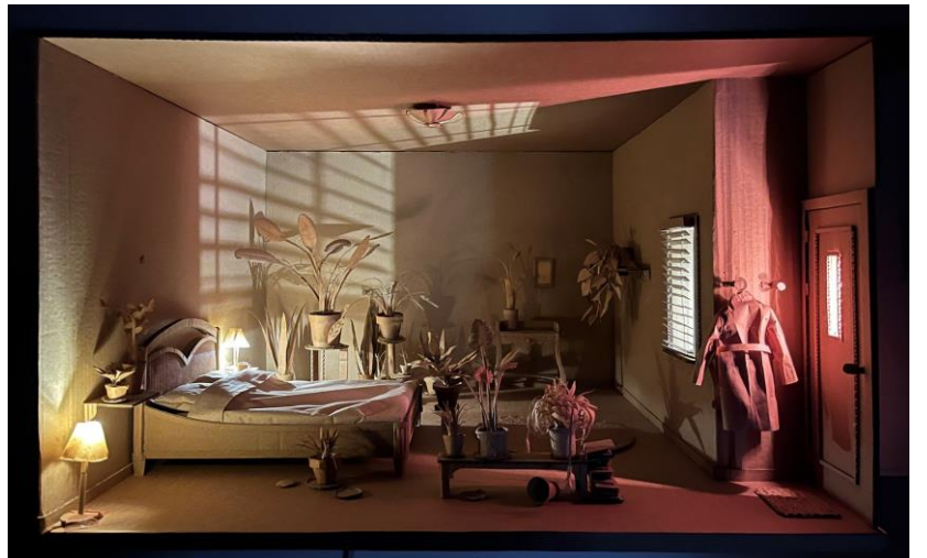
Elementen uit de installatie "A Body of Water"